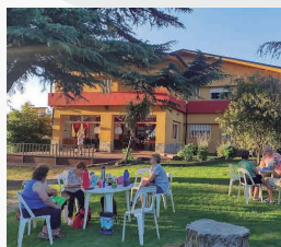
HOTEL 11 DE JUNIO