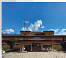
HOTEL 11 DE JUNIO